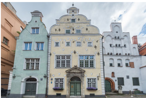
Les Trois Frères Les bâtiments les plus anciens